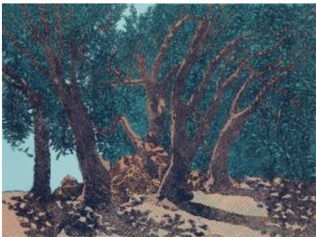
Olivový strom, barevný linoryt, 2015